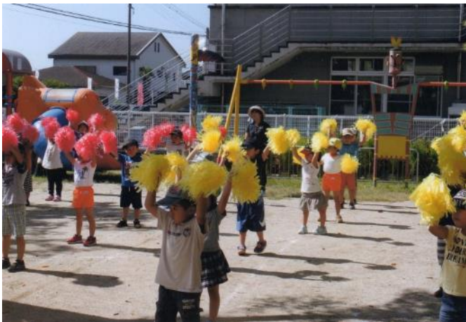
運動会の練習頑張っています！

* 子どもが道路に飛び出すと危険ですので必ず、門の上のカギは閉めて帰って下さい。ご協力よろしくお願ひします。