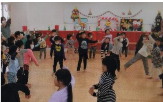
クリスマス会 みんなでダンス 「サンタさんの目は青だった!？」