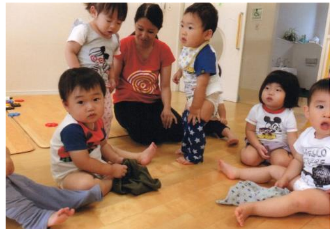
先生 ズボンはくの手伝って～